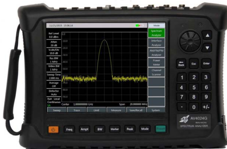
а) Вид спереди

Внешний вид анализаторов AV4024 с указанием мест нанесения знака утверждения типа и пломбирования приведен на рисунке 1.